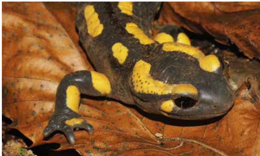
Ganze Feuersalamanderpopulationen sind dem Chytridpilz Batrachochytrium salamandrivorans bereits zum Opfer gefallen

Verfassung (und damit das Immunsystem) von Schlangen im Jahresverlauf in Abhängigkeit von Nahrungsangebot und Temperatur (McCoy et al. 2017). So könnte ein Temperaturanstieg während der Winterruhe, einer Zeit, in der Schlangen dem Pilz nur vermindert etwas entgegenzusetzen können, möglicherweise bessere Wachstumbedingungen für O. ophioidicola bedeuten (ALLENDER et al. 2015b). LORCH und Kollegen haben Hautläsionen untersucht, die in Nordamerika immer wieder bei Schlangen beobachtet werden, die aus der Winterruhe kommen und im Englischen oft als „hibernation blisters“ (Überwinterungsbläschen) bezeichnet werden. In drei Vierteln der Fälle konnte O. ophioidicola nachgewiesen werden (LORCH et al. 2016). Ob solche Läsionen wieder abklingen oder sich die Pilzinfektionen ausbreiten, dürfte von mehreren Faktoren abhängen. Statt einer aktuellen Zunahme der Fälle von SFD ist auch eine ganz andere Erklärung denkbar. Aufgrund unzureichenden Monitorings und technischer Limitierungen ist es