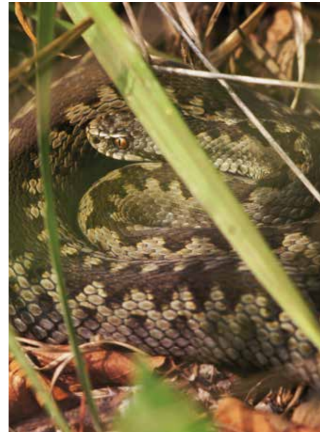
Die Kreuzotter bevorzugt kühlere Lebensräume – steigende Temperaturen im Rahmen des Klimawandels begünstigen die Ausbreitung von Pathogenen weiter nach Norden beziehungsweise in höhere Lagen

Anthropogene Einflüsse, die Schlangen und andere Reptilien bedrohen, sind vielfältig, doch als die vordringlichsten gelten Lebensraumverlust und (illegale) Naturentnahmen (BÖHM et al. 2013). Diese destruktiven Einflüsse sollen beispielsweise durch die Einrichtung von Schutzgebieten vermindert werden. Umso erstaunlicher die Tatsache, dass viele der rückläufigen Schlangenbestände sich in eben solchen Schutzgebieten befanden, was wiederum die Frage nach anderen Faktoren aufwirft (WINNE et al. 2007; READING et al. 2010). Im Fall der Waldklapperschlange ( Crotalus horridus ) in den nordöstlichen USA wurde überraschenderweise eine Pilzerkrankung der Haut für den beobachteten Individuenrückgang mitverantwortlich gemacht (CLARK et al. 2011).