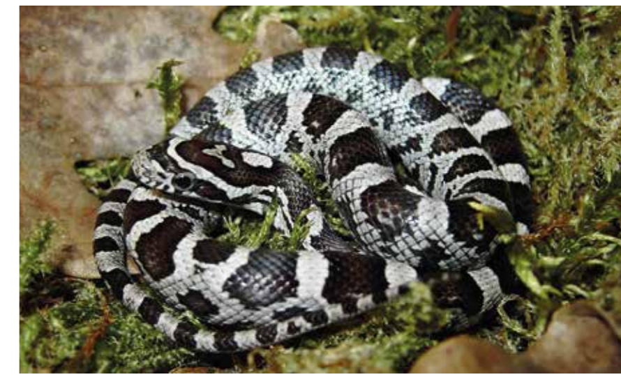
Bislang gibt es keine Hinweise darauf, dass der Pilz von Terrarientieren wie der Kornnatter auf wildlebende Schlangen in den USA oder Europa übertragen wurde

FRANKLINOS et al. (2017) beobachteten typische verdickte, bräunliche