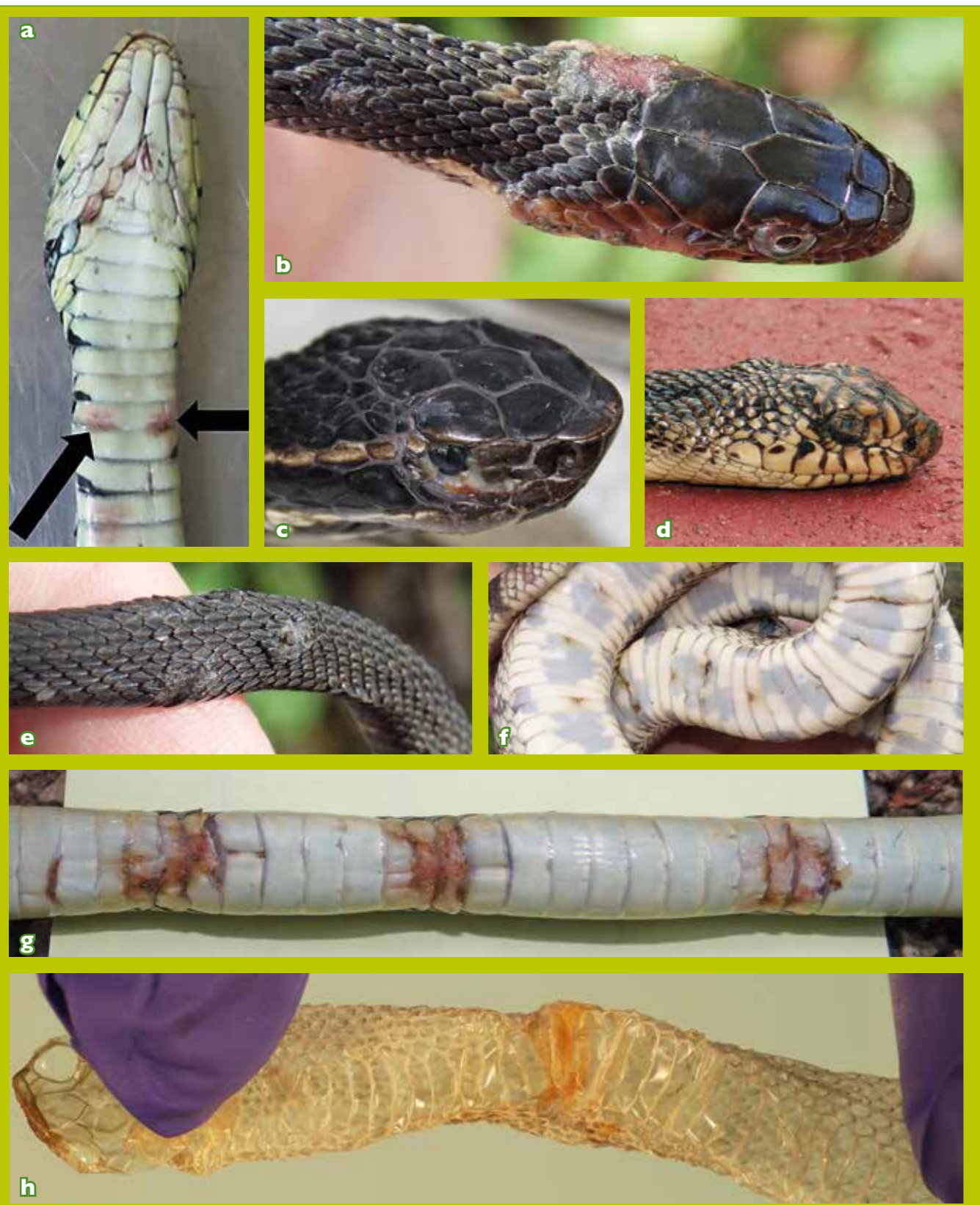
Von Ophidiomyces ophiodiicola verursachte Mykosen können unterschiedlich aussehen. Hautläsionen verschiedener Formen und Schweregrade am Beispiel von: a: Ringelnatter, Natrix helvetica , in Großbritannien Foto: Zoological Society of London; b: Gebänderter Wassernatter, Nerodia fasciata Foto: B.M. Glorioso (USGS Wetland and Aquatic Research Center); c: Wassermokassinotter, Agkistrodon piscivorus Foto: ALLENDER et al. 2015a; d: Louisiana-Kiefernatter, Pituophis ruthveni Foto: B.M. Glorioso (USGS Wetland and Aquatic Research Center); e: Gebänderter Wassernatter, Nerodia fasciata Foto: Brad M. Glorioso, USGS Wetland and Aquatic Research Center; f: Louisiana Kiefernatter, Pituophis ruthveni Foto: B.M. Glorioso (USGS Wetland and Aquatic Research Center); g: Bändernatter, Thamnophis sp. Foto: B.M. Glorioso (USGS Wetland and Aquatic Research Center); h: sowie einer Exuvie Foto: J. Lorch (USGS National Wildlife Health Center)

löser handelt (PARÉ & JACOBSON 2007). Experimentelle Infektionen von Wassermokassinottern ( Agkistrodon piscivorus ) und Kornnattern ( Pantherophis guttatus ) mit O. ophiodiicola lösen ein für SFD typisches Krankheitsbild aus und zeigen einen direkten kausalen Zusammenhang auf (ALLENDER et al. 2015a; LORCH et al. 2015).