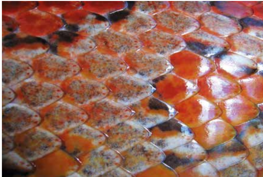
Die gesunde Schuppenhaut hat vor allem eine Barriere- und Schutzfunktion für Schlangen