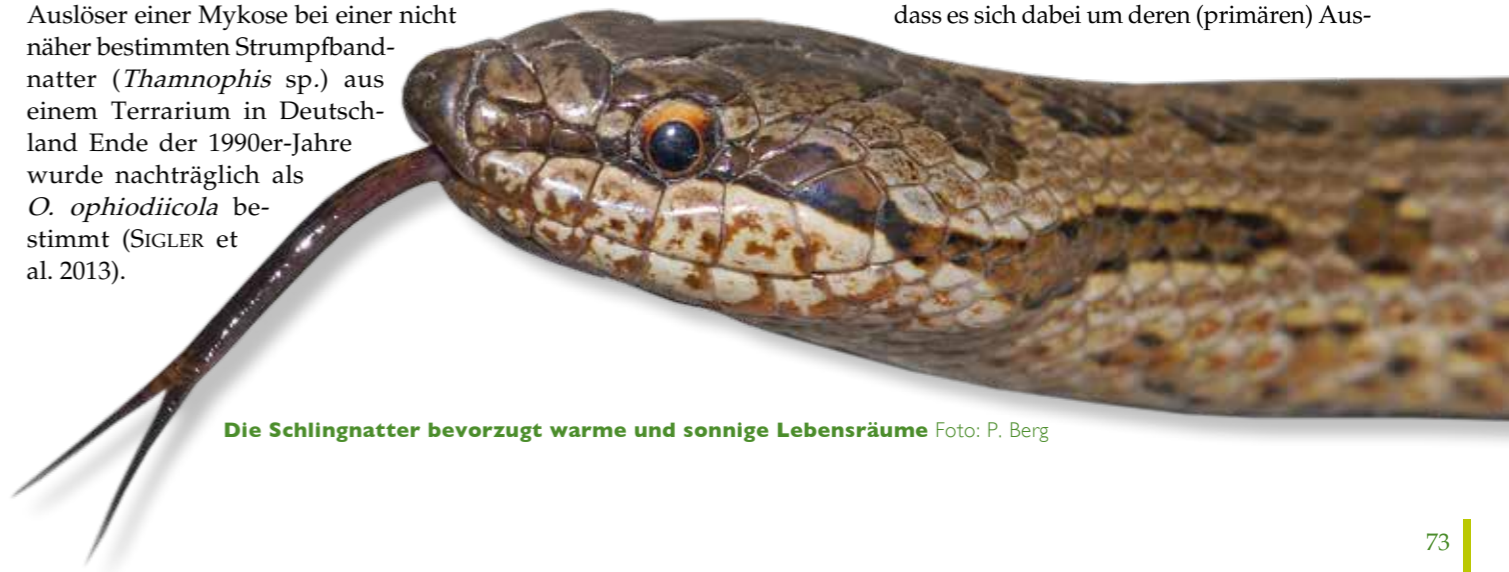
Die Schlingnatter bevorzugt warme und sonnige Lebensräume

Die Liste der nachgewiesenermaßen durch diesen Pilz infizierten Schlangentaxa zählt bereits über 30 (LORCH et al. 2016) und wächst kontinuierlich. Der Tiermediziner Elliott Jacobson vermutet, dass schlangenpathogene Pilze in der Vergangenheit oft fehlidentifiziert wurden. Morphologisch lassen sich O. ophiodiicola und nah verwandte Arten (siehe Kasten) nicht zweifelsfrei unterscheiden (SIGLER et al. 2013). Hinzu kommt, dass verschiedene Pilze auch die Haut gesunder Reptilien besiedeln und ihr reiner Nachweis in einer Hautinfektion nicht zugleich bedeuten muss, dass es sich dabei um deren (primären) Aus-